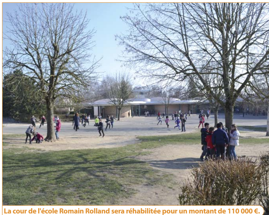
La cour de l'école Romain Rolland sera réhabilitée pour un montant de 110 000 €.