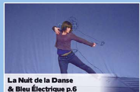
La Nuit de la Danse & Bleu Électrique p.6