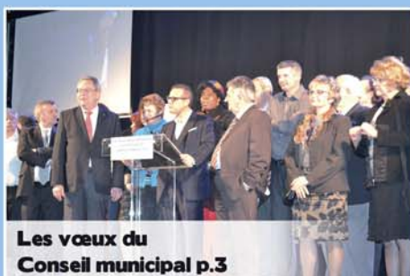
Les vœux du Conseil municipal p.3