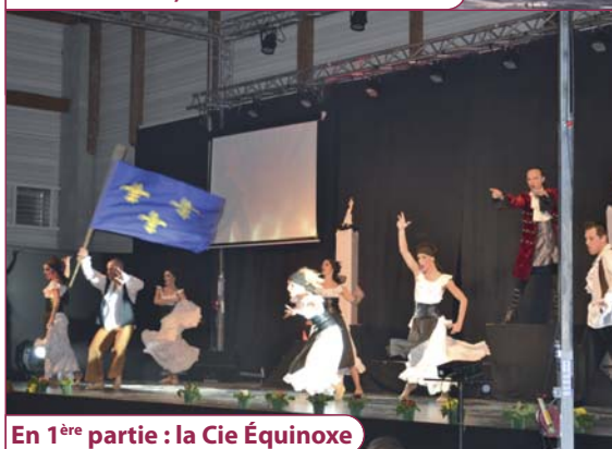
En 1 ère partie : la Cie Équinoxe