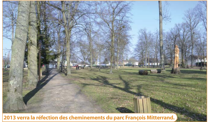
2013 verra la réfection des cheminements du parc François Mitterrand.