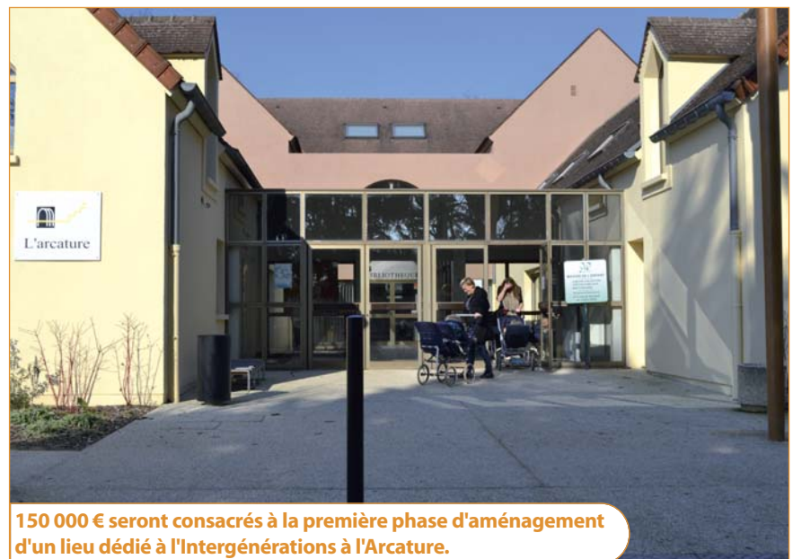
150 000 € seront consacrés à la première phase d'aménagement d'un lieu dédié à l'Intergénération à l'Arcature.

Vous pouvez retrouver l'intégralité des débats du conseil municipal du 31 janvier sur le site internet de la Ville : www.mairie-vaux-le-penil.fr