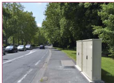
Une armoire de distribution

Ces dernières semaines, l'ensemble des armoires de distribution de la fibre ont été installées sur la zone concernée. Le tirage et le raccordement des câbles seront réalisés de début juillet jusqu'à la mi-août. Un gel de trois mois est ensuite légalement imposé afin que chaque opérateur puisse se raccorder s'il le souhaite au réseau installé par Orange, et que tous soient sur un pied d'égalité lorsque la commercialisation débutera. Les 2 ème et 3 ème tranches seront mises en œuvre en 2014 et 2015 et précédées de réunions publiques d'information.