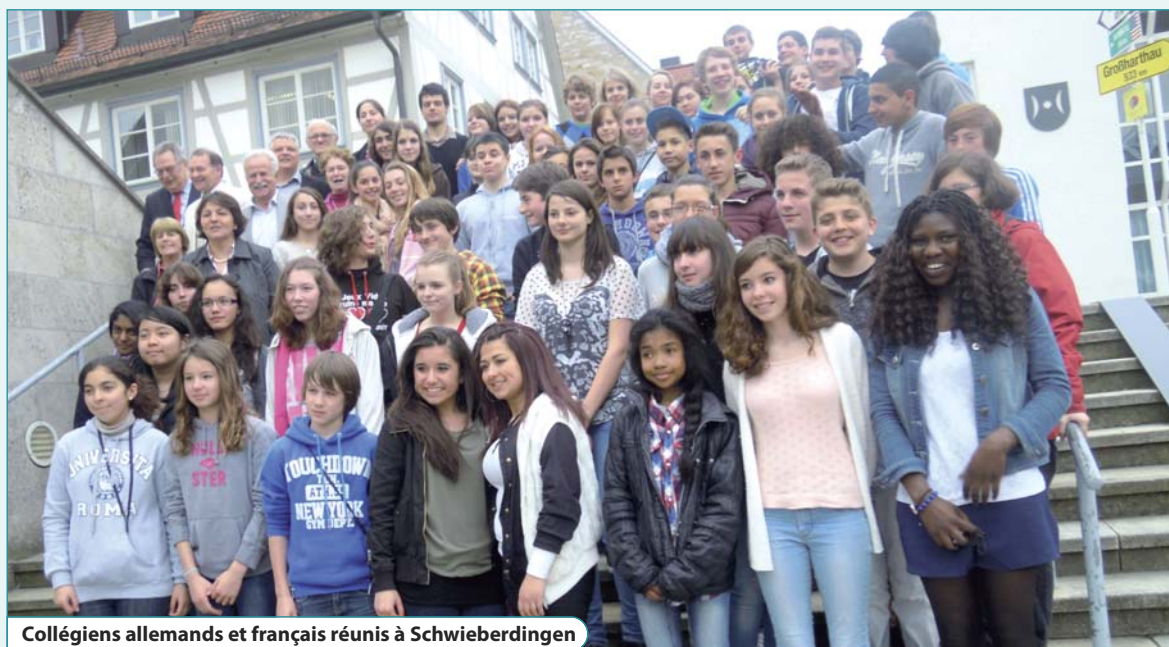
Collégiens allemands et français réunis à Schwieberdingen

Lors de la deuxième partie de l'échange franco-allemand, du 20 au 26 avril 2013, nous avons, bien sûr fêté, le mardi 23 avril, les trente ans d'échanges scolaires à Schwieberdingen. Cette fois-ci, pièces de théâtre, discours... , tout était en allemand, et les élèves du collège se sont particulièrement distingués !