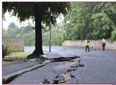
La côte Sainte Gemme après l'orage

Même s'il n'a pu contenir toute l'eau qui s'est déversée sur Vaux-le-Pénil, le bassin de rétention situé sous le square du 19-Mars 1962 a permis d'éviter une catastrophe et limité le nombre d'habitations touchées. Preuve s'il en fallait de l'utilité de celui qui sera réalisé Place des Fêtes dans les prochains mois, puis d'un autre à proximité de la mairie principale ultérieurement.