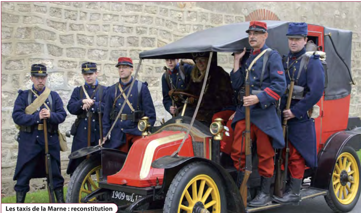
Les taxis de la Marne : reconstitution

Les 5, 6, 7 septembre 2014, Vaux-le-Pénil commémorera la rencontre du général Joffre et du maréchal French au château de la ville, lors de laquelle fut préparée la bataille de la Marne.