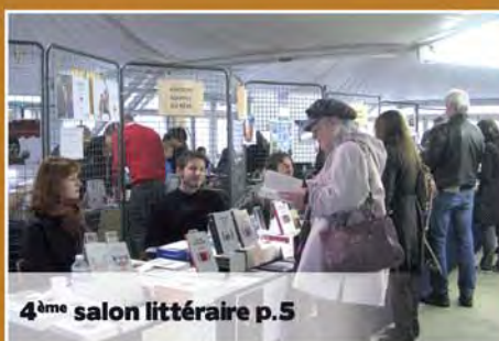
4 ème salon littéraire p.5