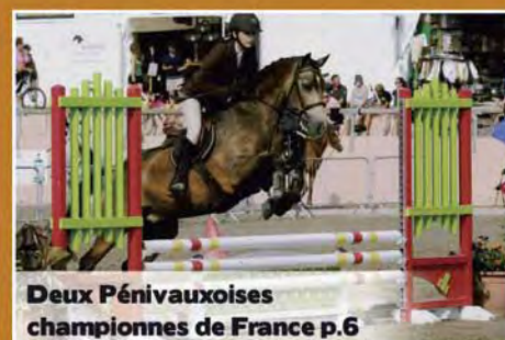
Deux Pénivauxoises championnes de France p.6