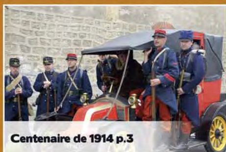
Centenaire de 1914 p.3