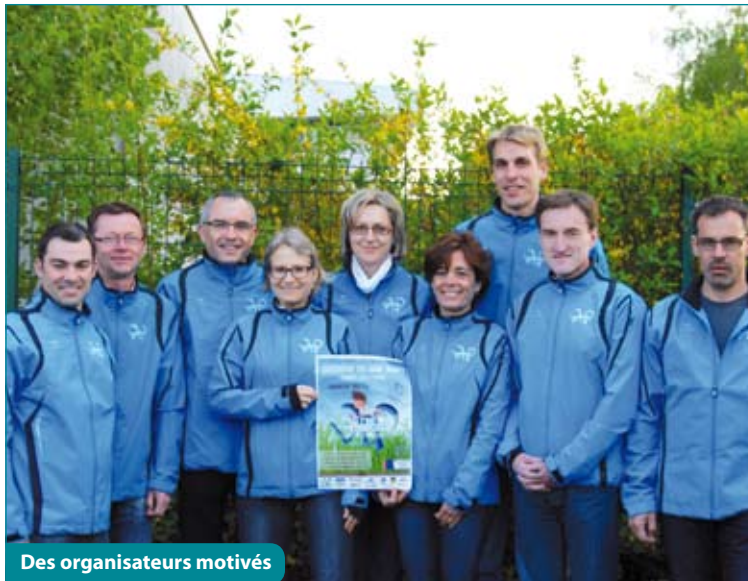
Des organisateurs motivés