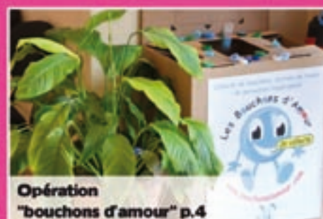
Opération "bouchons d'amour" p.4