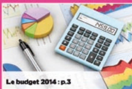
Le budget 2014 : p.3