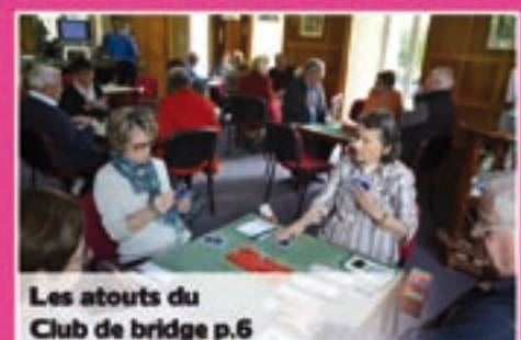
Les atouts du Club de bridge p.6