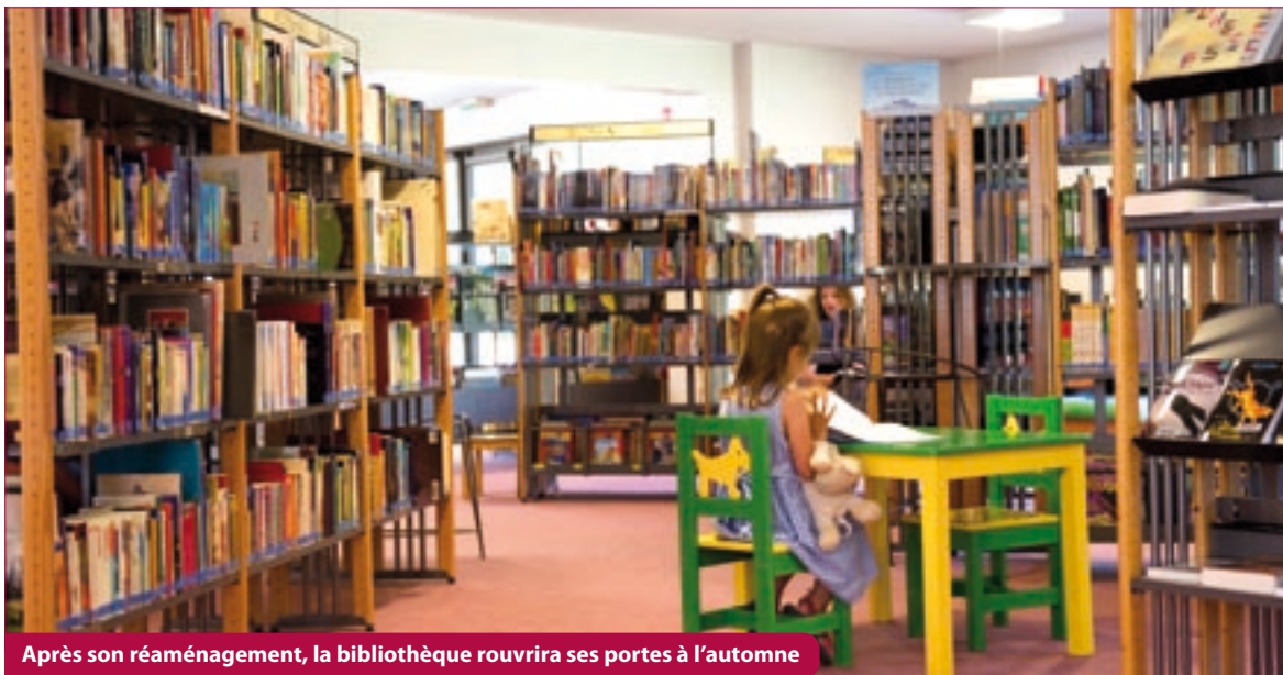
Après son réaménagement, la bibliothèque rouvrira ses portes à l'automne

La séance du conseil municipal du 24 avril lors de laquelle le budget a été adopté est disponible dans son intégralité en vidéo sur le site de la Ville ( www.mairie-vaux-le-penil.fr ), rubrique Citoyenneté / Conseil municipal en vidéo.