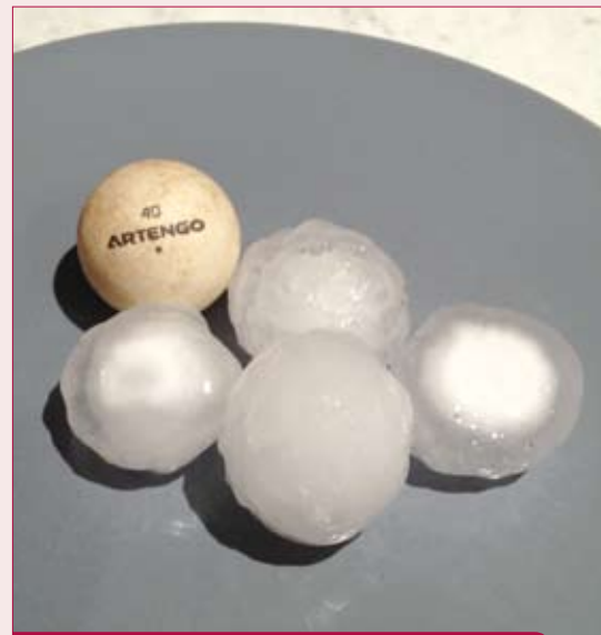
Des grêlons plus gros que des balles de Ping pong

Au total, et dans l'attente d'une estimation précise, le préjudice s'élève à plusieurs centaines de milliers d'euros. Le 16 juin, la préfecture a précisé que les orages de grêle ne rentrent pas dans le champ des catastrophes naturelles, dont la demande de reconnaissance a été un temps envisagée par la municipalité, mais dans celui des assurances traditionnelles qui couvrent ce type de risques.