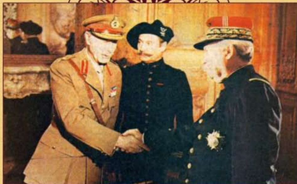
Le 5 septembre 1914, rencontre décisive entre le Maréchal French, commandant le corps expéditionnaire britannique, et le Général Joffre, généralissime des armées françaises.