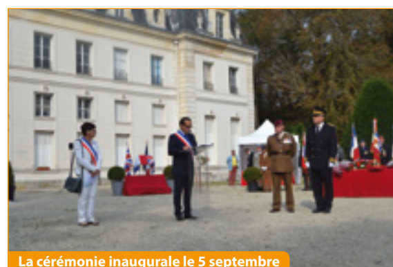
La cérémonie inaugurale le 5 septembre