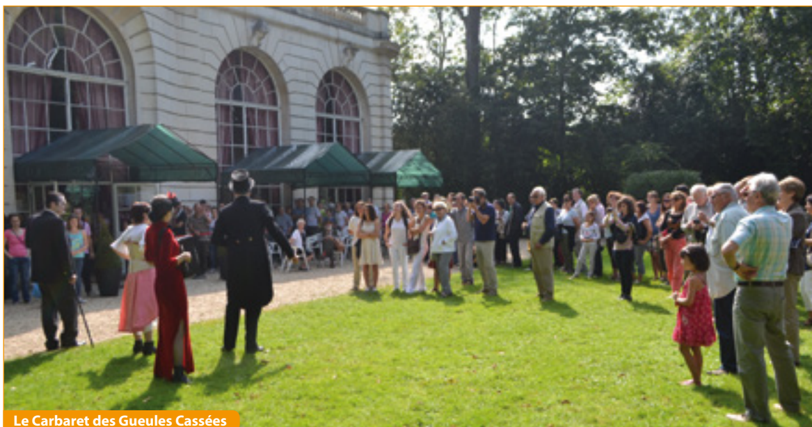
Le Carbare des Gueules Cassées