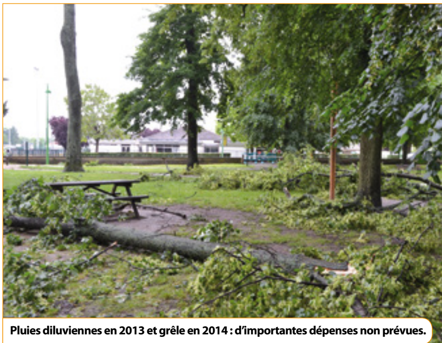
Pluies diluviennes en 2013 et grêle en 2014 : d'importantes dépenses non prévues.

Pierre Herrero : Nous ferons tout pour qu'il en soit ainsi. Je rappelle que Vaux-le-Pénil compte parmi les villes de plus de 10 000 habitants en Seine-et-Marne dont la moyenne des trois taxes (habitation, foncier bâti et foncier non bâti) est la plus faible. Nous avons toujours veillé à appliquer une fiscalité maîtrisée et juste. Pour preuve, elle n'a augmenté que de 2,8 % depuis 2008. Nous sommes aujourd'hui soumis à des contraintes extérieures fortes et exceptionnelles, indépendantes de notre gestion, qui nécessitent des réponses tout aussi fortes et justes. C'est le sens des décisions que nous prenons. Décisions dont les Pénivauxois, je l'espère et je le crois, comprendront la nécessité et la portée.