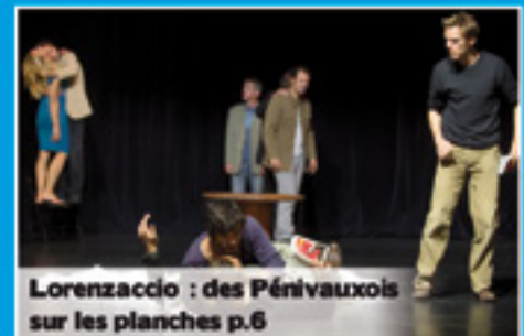
Lorenzaccio : des Pénivauxois sur les planches p.6