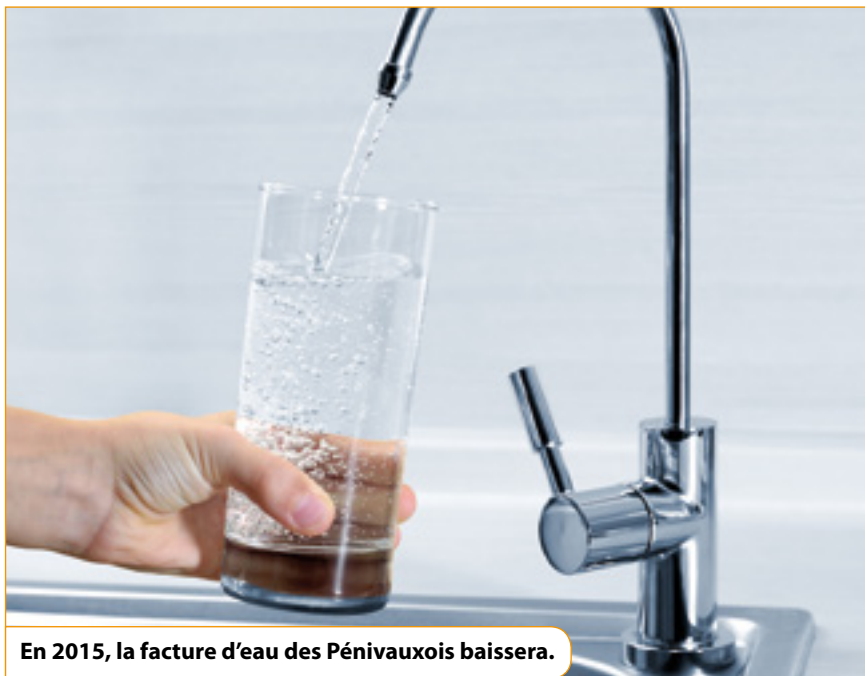
En 2015, la facture d'eau des Pénivauxois baissera.