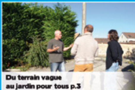
Du terrain vague au jardin pour tous p.3