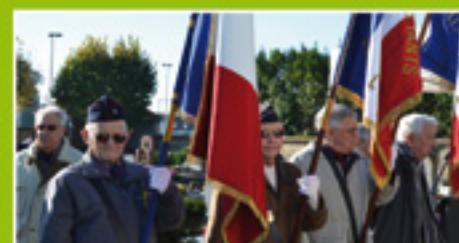
Anciens combattants, sentinelles de la mémoire p.6