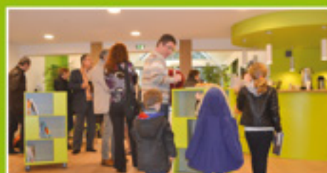
L'Arcature : un art de vivre ensemble p.4 et 5