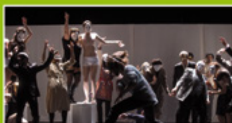
Lorenzaccio : une création éblouissante p.2