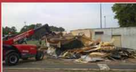
Travaux d'été p.4