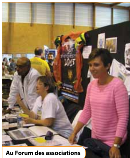
Au Forum des associations

Renseignements : www.mairie-vaux-le-penil.fr/decouvrir/le-comite-des-fetes.html