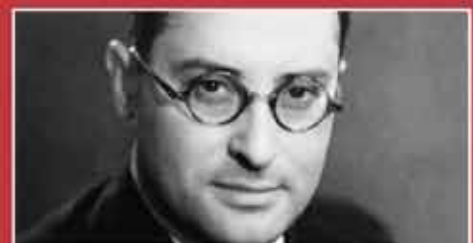
Hommage à Jean Zay p.6