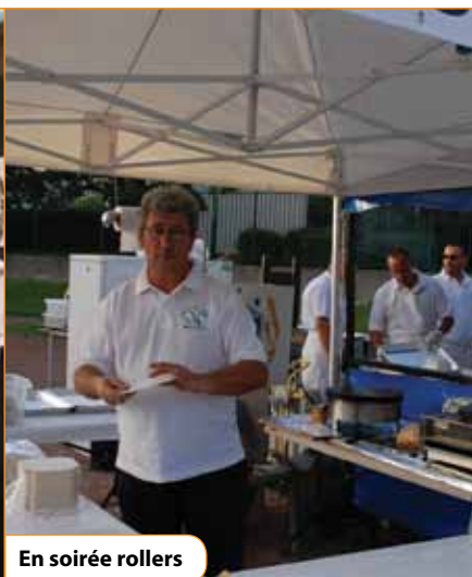
En soirée rollers