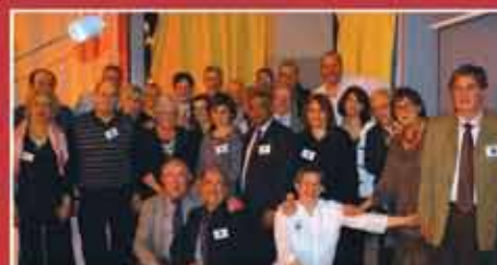
Le Comité des Fêtes, grand animateur de Vaux-le-Pénil ! p.5