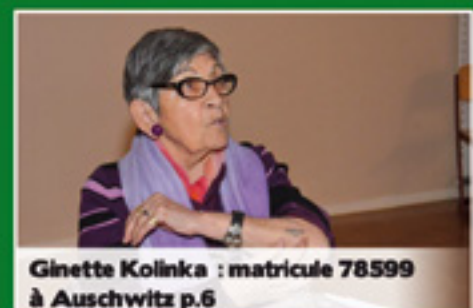
Ginette Kolinka : matricule 78599 à Auschwitz p.6