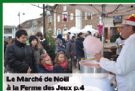
Le Marché de Noël à la Ferme des Jeux p.4