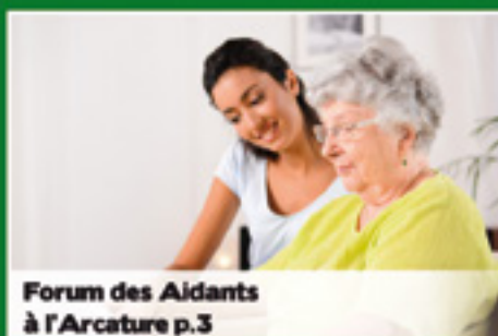
Forum des Aidants à l'Arcature p.3