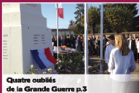
Quatre oubliés de la Grande Guerre p.3