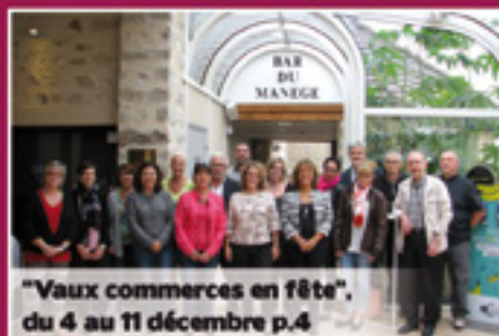
"Vaux commerces en fête", du 4 au 11 décembre p.4