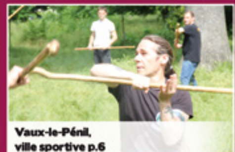
Vaux-le-Pénil, ville sportive p.6