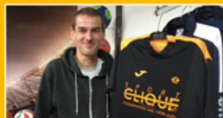
Aux côtés des clubs, Sport Clique mouille le maillot p.5