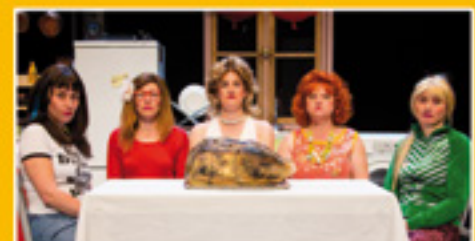
Les Femmes savantes p.6