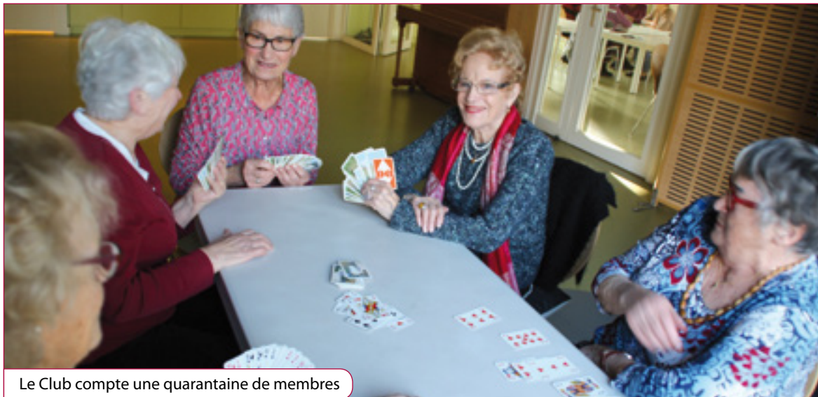
Le Club compte une quarantaine de membres

Depuis plus de 40 ans, l'association du Club Le Bon Temps offre aux seniors la possibilité de se réunir régulièrement à travers de nombreuses activités et de préserver ainsi une vie sociale active.