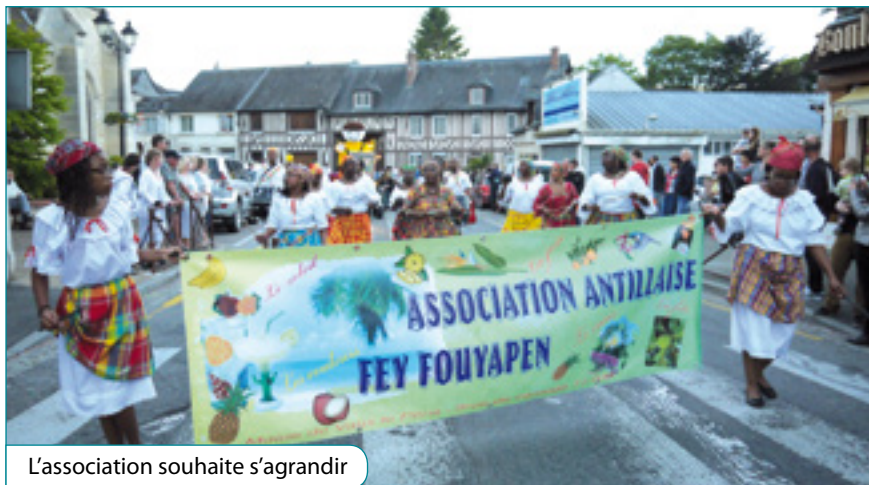
L'association souhaite s'agrandir