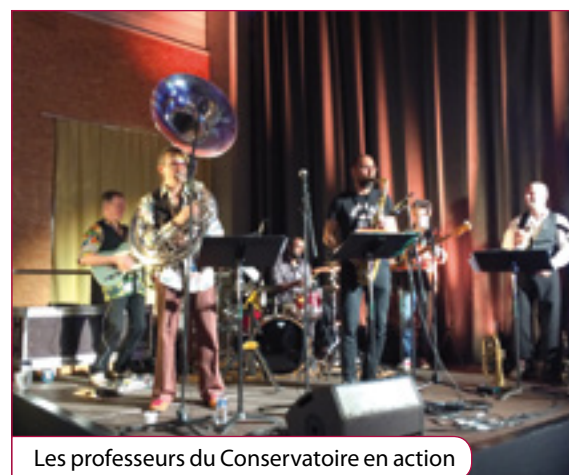
Les professeurs du Conservatoire en action