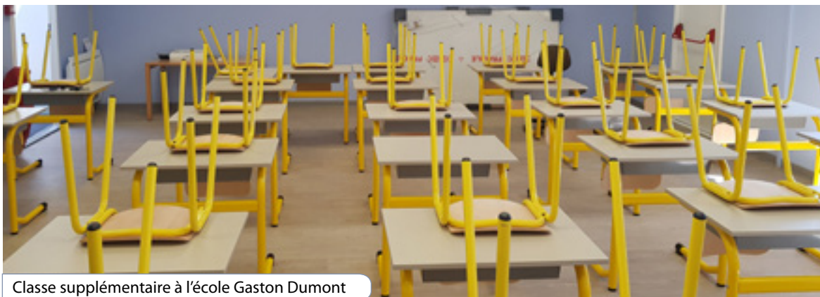
Classe supplémentaire à l'école Gaston Dumont

La période estivale a été l'occasion d'effectuer plusieurs travaux dans les écoles. Deux modules en bois ont été posés à l'école Romain Rolland et Jean-Robert Rouchon afin de stocker le matériel extérieur de loisir (vélos, ballons...). Pour permettre l'accueil de l'une des deux classes supplémentaires évoquées précédemment, un des locaux de la bibliothèque a été entièrement rénové. Enfin, suite à une canalisation en eau potable percée à Jean-Robert Rouchon, la décision a été prise de changer toute la ligne d'après compteur jusqu'à la chaufferie.