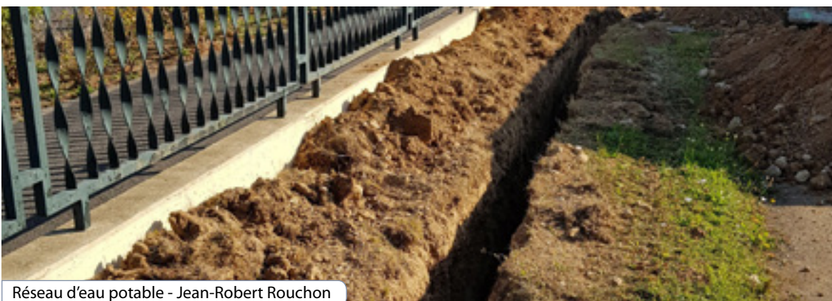
Réseau d'eau potable - Jean-Robert Rouchon