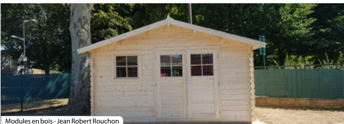
Modules en bois - Jean Robert Rouchon