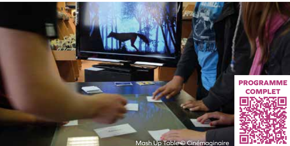
Mash Up Table

Les classes de primaire, le centre de loisirs, le Conservatoire de musique et les seniors dans le cadre de la Semaine Bleue (du 2 au 13 octobre) profiteront des expositions numériques et des casques virtuels mis à leur disposition.