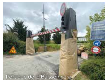
Portique de la Buissonnière

Malgré la politique de l'État visant à diminuer ses dotations et la crise sanitaire qui a considérablement impacté les communes, la ville de