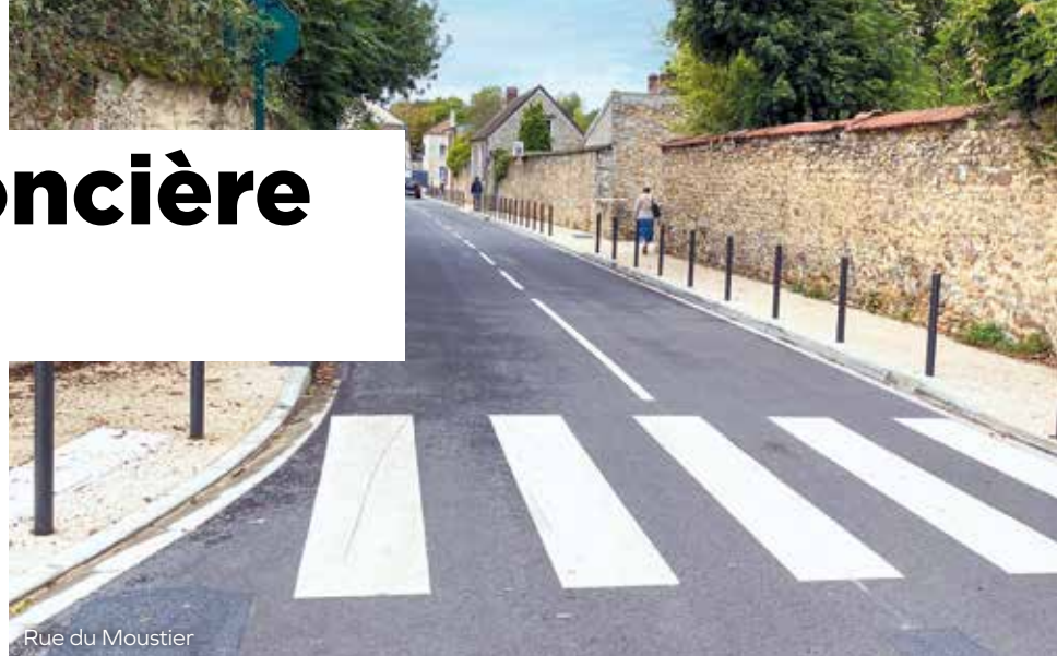
Rue du Moustier

Pour les autres Pénivauxois, propriétaires (60 %), ils verront leur taxe foncière augmenter, la part strictement communale de l'augmentation du taux de 10