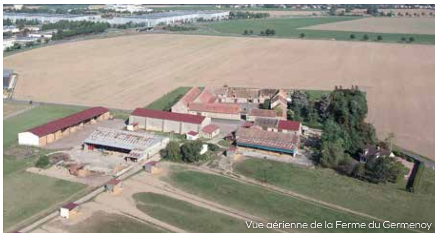
Vue aérienne de la Ferme du Germenoy

Le diagnostic communal par le bureau d'études sélectionné est en cours. Il laissera place début 2024 à la construction du Projet d'Aménagement et de Développement Durable (PADD), pièce fondamentale du PLU qui exposera les objectifs d'urbanisme et d'aménagement de Vaux-le-Pénil pour les 10 prochaines années.