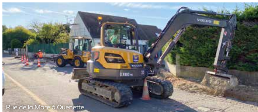
Rue de la Mare à Quenette

Une partie de ces investissements n'est possible que grâce à cette augmentation de la fiscalité. Les propriétaires seront bien conscients que tout ce qui participe à la revalorisation de la ville et de son environnement ne fera que protéger et renforcer la valeur patrimoniale de leurs biens.