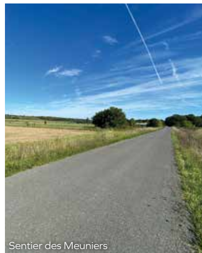
Sentier des Meuniers

d'Activités et créer une dynamique commerciale forte en zone urbaine.