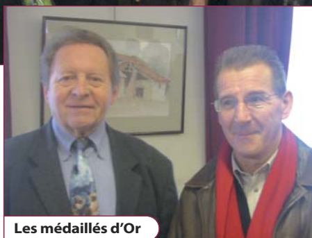
Les médaillés d'Or