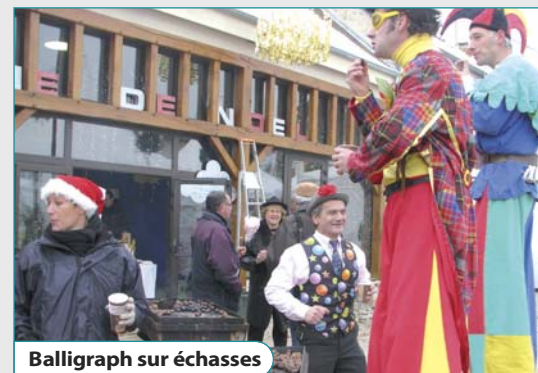
Balligraph sur échasses