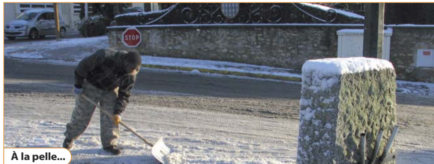
À la pelle...