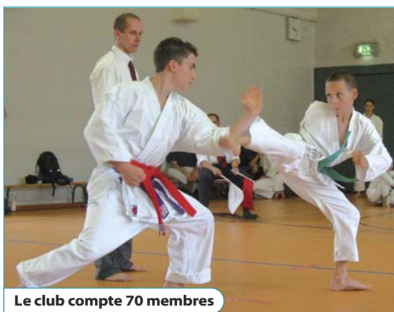
Le club compte 70 membres