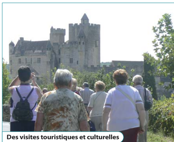
Des visites touristiques et culturelles

Membre ou non du club, vous êtes cordialement invité à cette réunion qui se terminera autour d'un goûter.