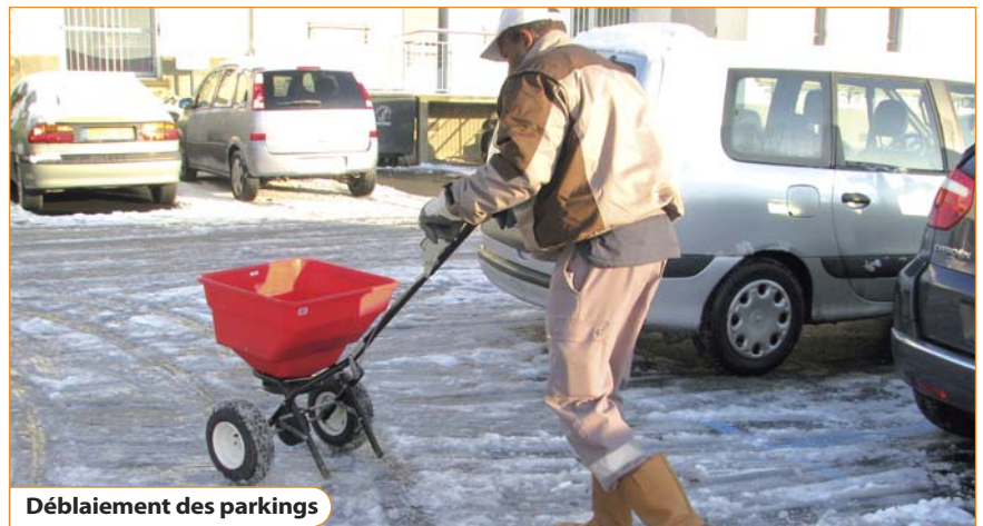
Déblaiement des parkings