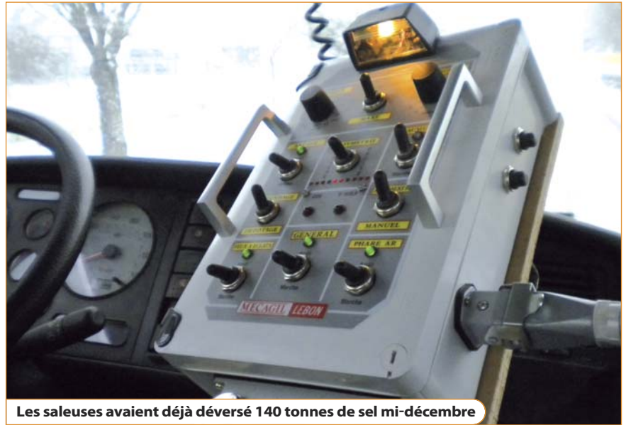
Les saleuses avaient déjà déversé 140 tonnes de sel mi-décembre