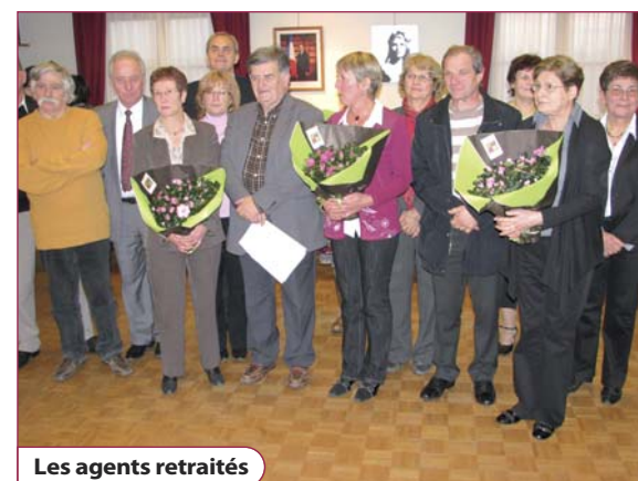
Les agents retraités