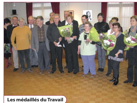
Les médaillés du Travail