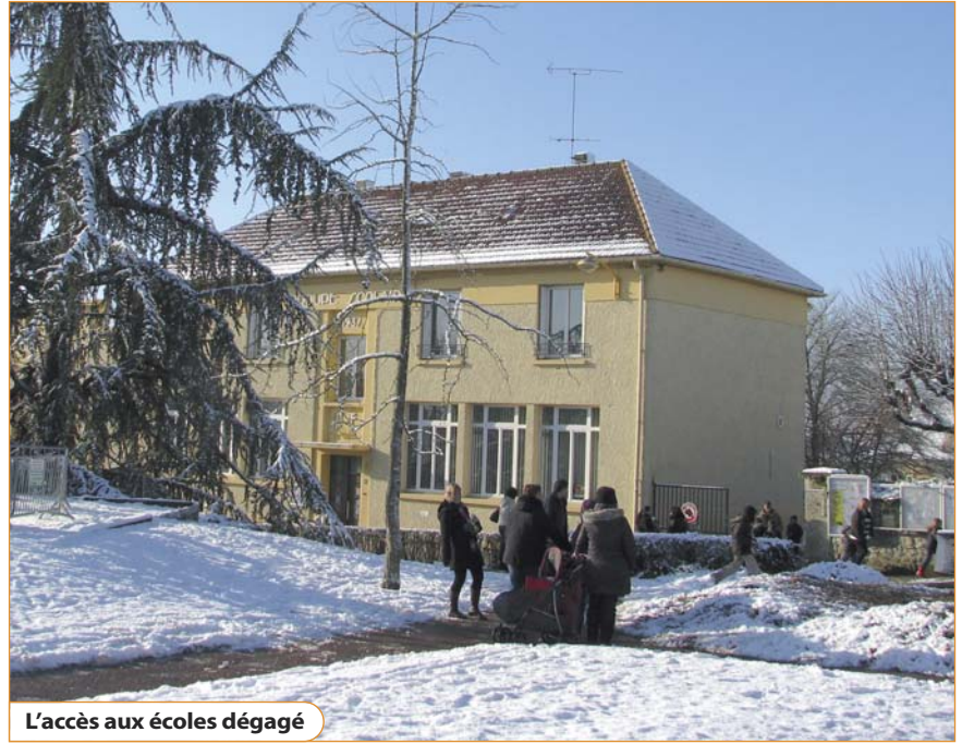
L'accès aux écoles dégagé

Enfin, le conseiller municipal en appelle au civisme : « La loi rend chaque riverain responsable du déneigement du trottoir qui borde son habitation, non seulement devant sa porte mais sur toute la longueur de son terrain. J'ajoute que le stationnement sauvage des véhicules sur les trottoirs constitue un obstacle supplémentaire pour les piétons. Pensons aux enfants, aux personnes âgées! » L'hiver est là, avec ses aléas : pouvoir se déplacer ne dépend pas seulement des services municipaux, c'est l'affaire de tous.