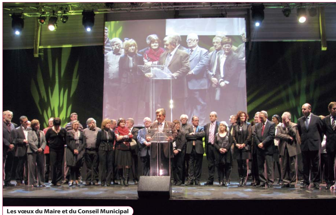
Les vœux du Maire et du Conseil Municipal