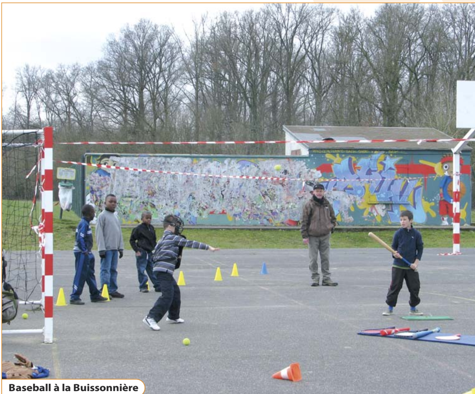
Baseball à la Buissonnière

L'ensemble de ces actions nourrit le tissu associatif et contribue à une utilisation optimale des infrastructures mises à la disposition du sport et de la culture par la Ville de Vaux-le-Pénil.