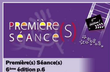
Première(s) Séance(s) 6 ème édition p.6