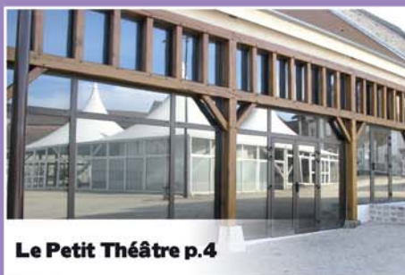
Le Petit Théâtre p.4