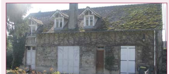
Maison des Égrefins

Un dossier complet et illustré de ces ventes est disponible au service urbanisme, 479bis rue de la Justice. Tél. : 01 64 10 46 96 ou auprès de Gérald Babillotte : 01 64 10 46 91. Le dossier est également consultable sur www.mairie-vaux-le-penil.fr