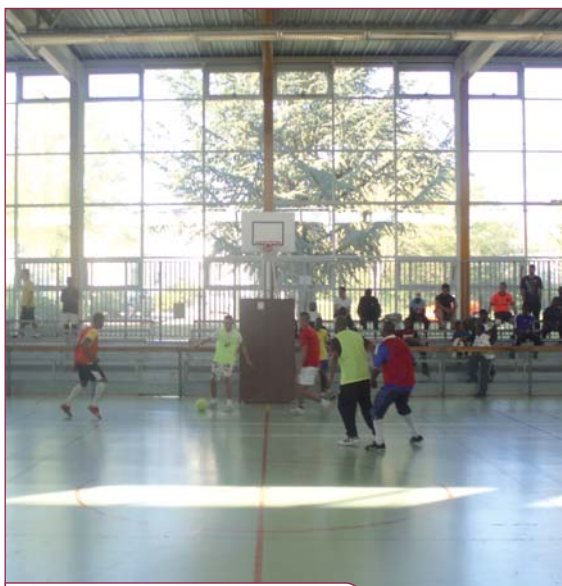
Tournoi le 9 avril à Ladoumègue

Les Sons de la Ferme résonnent en juin. Ça aussi c'est nouveau : le festival des musiques actuelles n'a plus lieu en septembre mais en juin, samedi 18 pour être précis, l'après-midi pour les groupes locaux et en soirée pour les têtes d'affiche qui seront, cette année, Jul Erades, Guillaume Grand et Hangar. Programmation définitive communiquée ultérieurement.