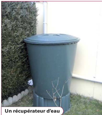
Un récupérateur d'eau

La commune renouvelle la mise en vente des récupérateurs d'eau, le SMITOM-LOMBRIC celle des composteurs. À moitié prix !