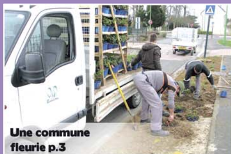
Une commune fleurie p.3