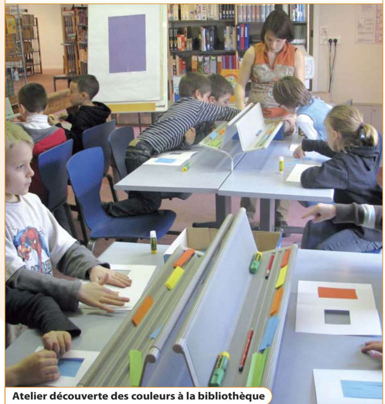
Atelier découverte des couleurs à la bibliothèque

La Ferme des Jeux n'est pas en reste. Quelque 800 élèves de maternelle et de primaire bénéficient du dispositif École et cinéma , financé par la Mairie, qui leur permet de voir gratuitement 6 films dans l'année. Quant aux spectacles vivants "jeune public" programmés dans le cadre de la saison culturelle, ils donnent lieu en journée à des séances spéciales réservées aux scolaires.