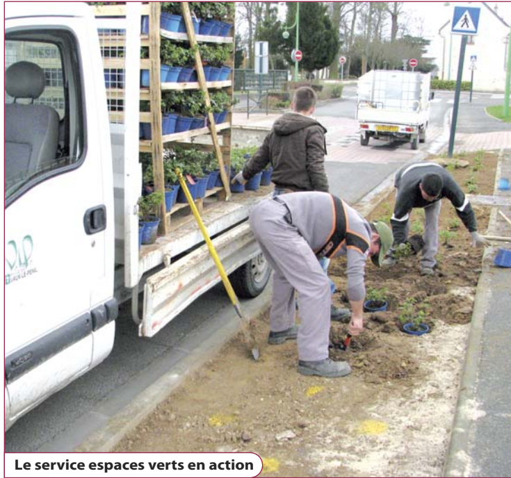
Le service espaces verts en action

Exemple : les parterres maçonnés remplacent les bacs qui présentaient un taux d'évaporation important ; ils peuvent, de plus, être fertilisés par le compost obtenu à partir du broyage des végétaux. Autre exemple : le choix des variétés - bégonias, géraniums, fuchsias, ... - permet d'associer économie d'arrosage, longévité des plants et diversité des couleurs.