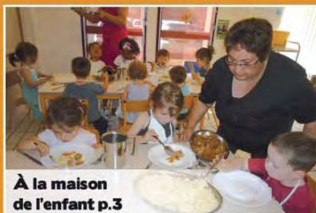
À la maison de l'enfant p.3