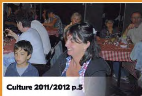
Culture 2011/2012 p.5