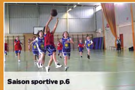
Saison sportive p.6