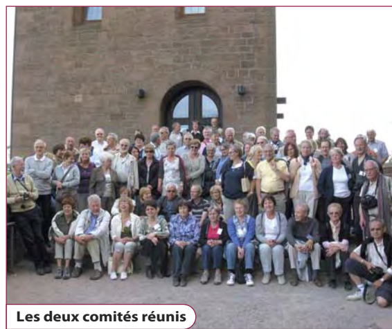
Les deux comités réunis