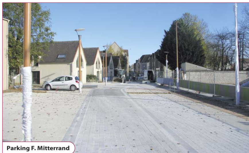
Parking F. Mitterrand