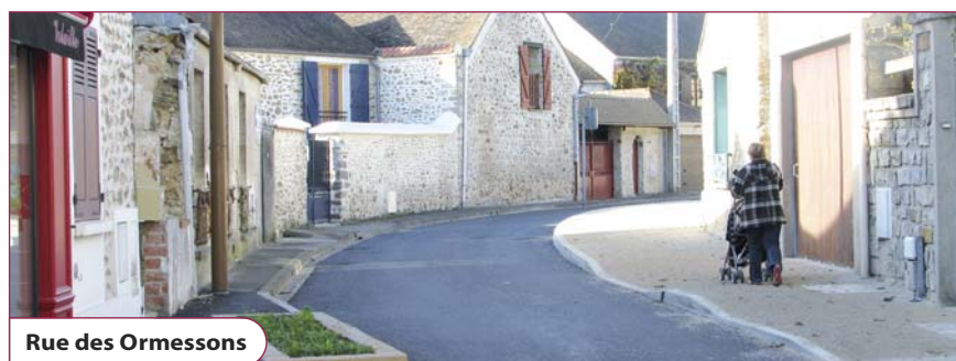
Rue des Ormessons