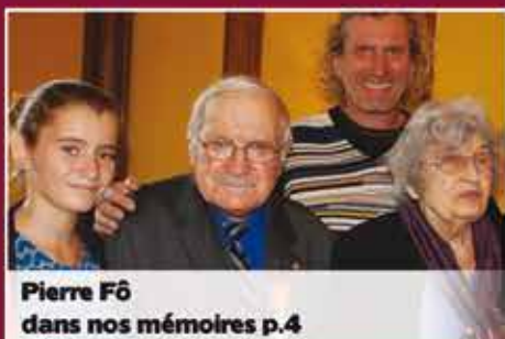
Pierre F6 dans nos mémoires p.4