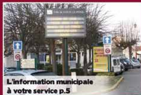
L'information municipale à votre service p.5