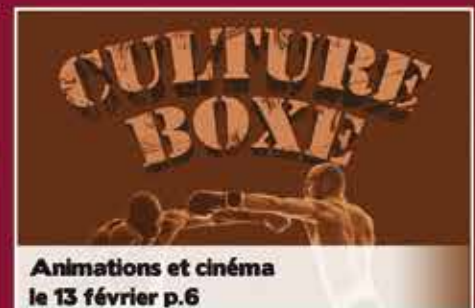
Animations et cinéma le 13 février p.6