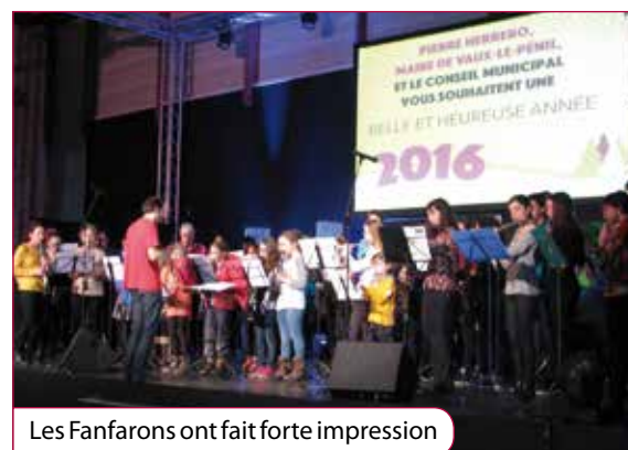
Les Fanfarons ont fait forte impression

La vidéo de la cérémonie des vœux est en ligne sur le site de la Ville ( www.mairie-vaux-le-penil.fr ).