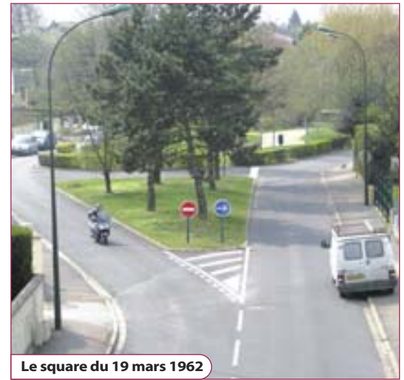
Le square du 19 mars 1962

Horaire d'été de la déchetterie. Valable jusqu'au 31 octobre. Du lundi au vendredi : de 15h00 à 19h00. Samedi : de 10h00 à 19h00. Dimanche : de 10h00 à 13h00.