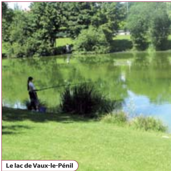
Le lac de Vaux-le-Pénil

À chaque printemps, les services techniques municipaux plantent différentes espèces sur le territoire communal. Une première cette année : des rosiers en centre-ville, recouverts d'un paillage qui retient l'eau et diminue du même coup l'arrosage. Tout comme le bannissement des désherbants chimiques et autres produits phytosanitaires polluants, cette nouvelle façon d'entretenir les plantations s'inscrit dans le code de bonne conduite environnementale suivi par les services municipaux.