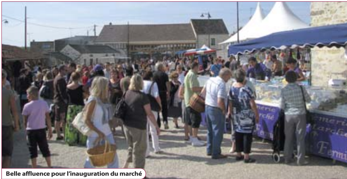
Belle affluence pour l'inauguration du marché