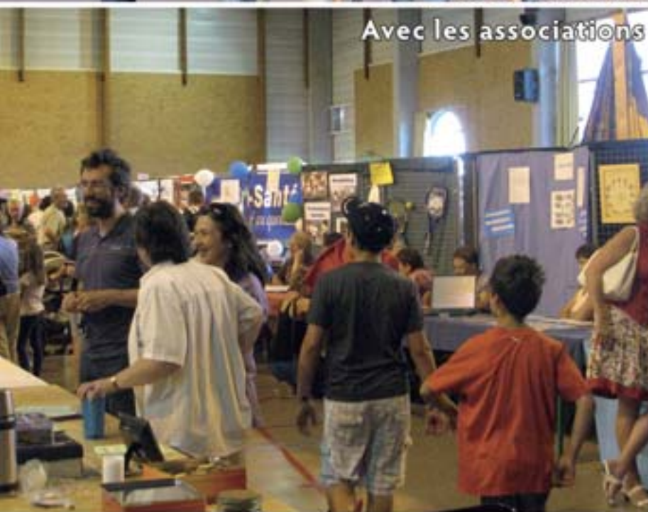
Avec les associations