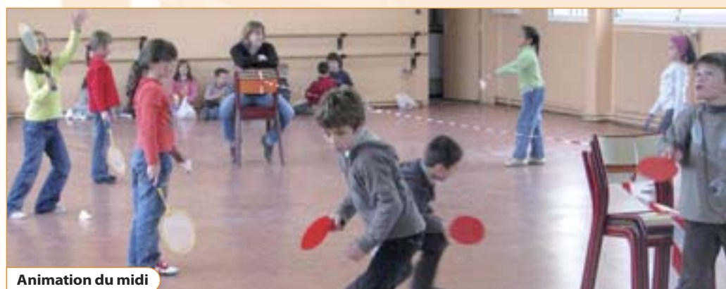
Animation du midi

NB : le vendredi 3 juin 2011 sera vaqué dans les écoles (pont de l'Ascension). En revanche, le mercredi 3 novembre 2010 sera un jour scolaire normal, avec les services habituels assurés (accueils et étude surveillée, restauration).