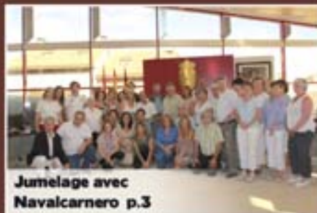
Jumelage avec Navalcarnero p.3