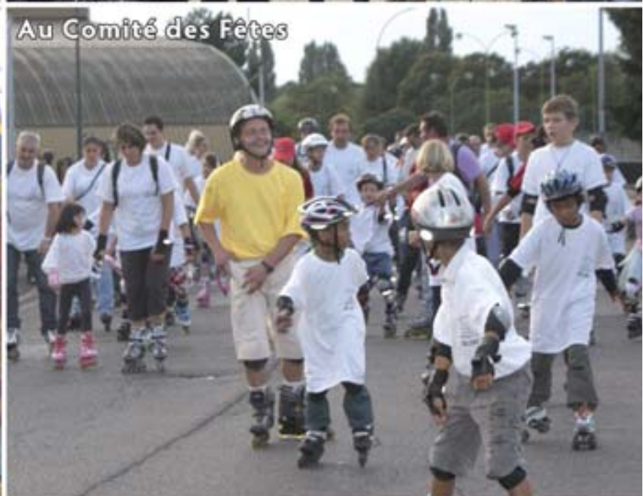
Au Comité des Fêtes