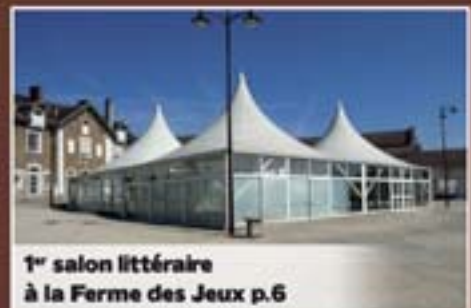
1 er salon littéraire à la Ferme des Jeux p.6