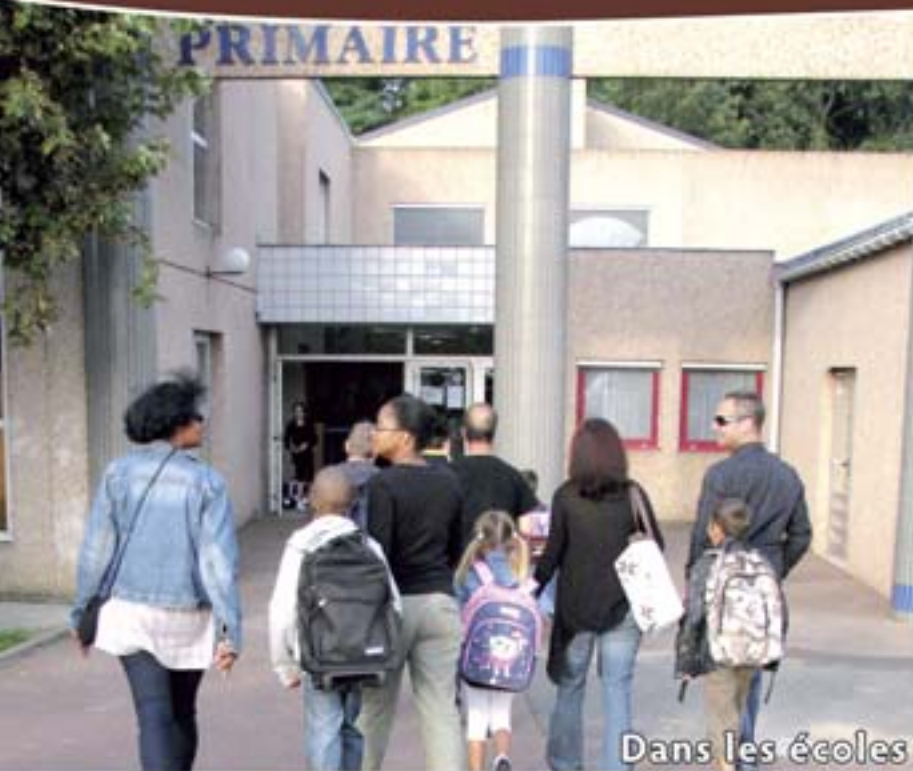
Dans les écoles

Le magazine de l'information municipale - Octobre 2010