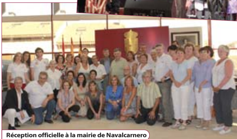
Réception officielle à la mairie de Navalcarnero

amie à la terrasse de Bistro Chic, ouvert pendant toute la durée du marché.