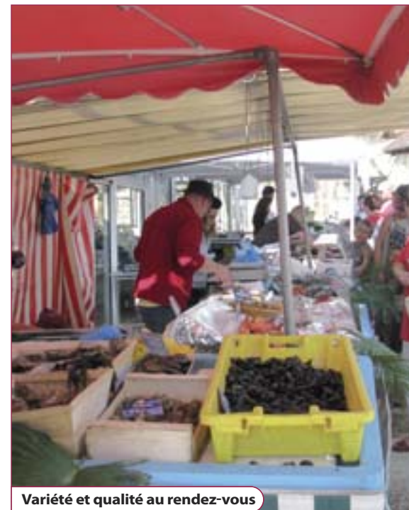
Variété et qualité au rendez-vous