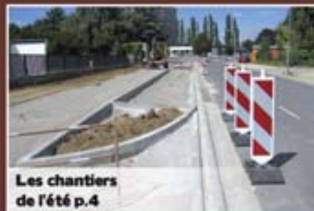
Les chantiers de l'été p.4